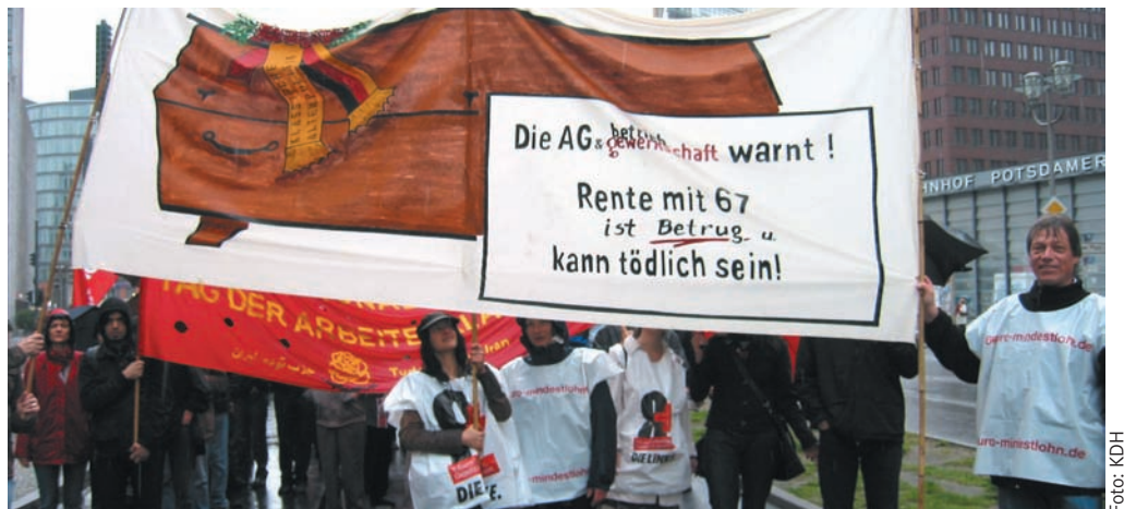
Die drastische Warnung der Berliner AG Betrieb & Gewerkschaft der LINKEN im Demonstrationszug am 1. Mai fiel auf: „Rente mit 67 ist Betrug und kann tödlich sein!“

Dieser Wahnsinn hat Methode: Die Regierung Merkel (CDU) gibt es offen zu: „Ziel ist eine flächendeckende Verbreitung der kapitalgedeckten Zusatzversicherung“. Das freut die Versicherungsindustrie, die fette Profite einstreicht. Die Zeche zahlen vor allem junge Menschen: Sie berappen die private Altersvorsorge alleine – und bei relativ stabilen Rentenbeiträgen erhalten sie im Ruhestand eine geringere Nettorente.