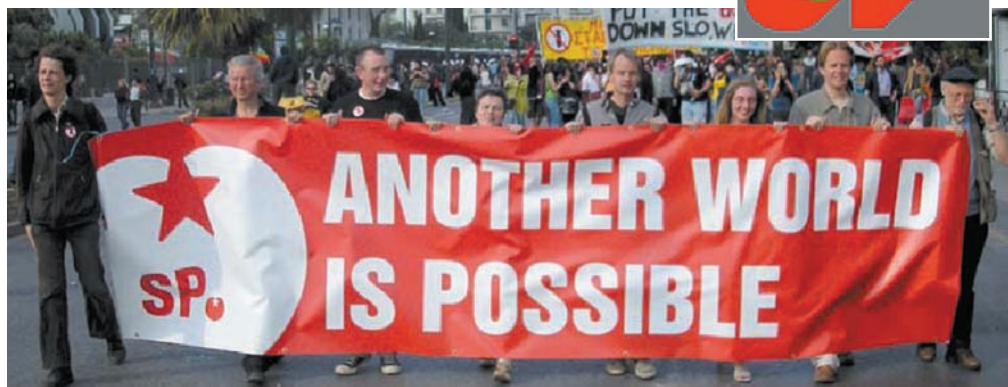
Die „Rote Tomate mit dem Stern“ ist das Symbol der SP in den Niederlanden.

In Wahlkämpfen produzieren wir kleine Werbefilme, die mit Humor gemacht sind.