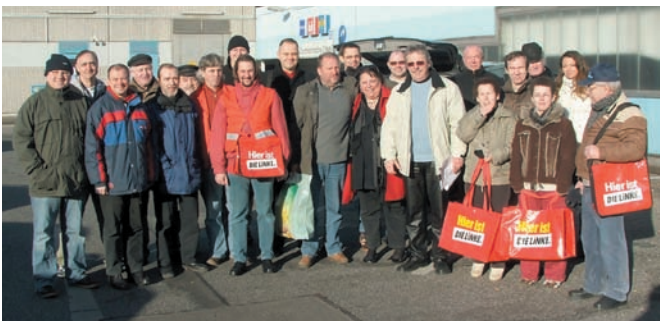
Erfolge der LINKEN sind Ergebnis des solidarischen Handelns der gesamten Partei. Hier: Genossinnen und Genossen aus Mecklenburg-Vorpommern beim Bürgerschaftswahlkampf in Hamburg.