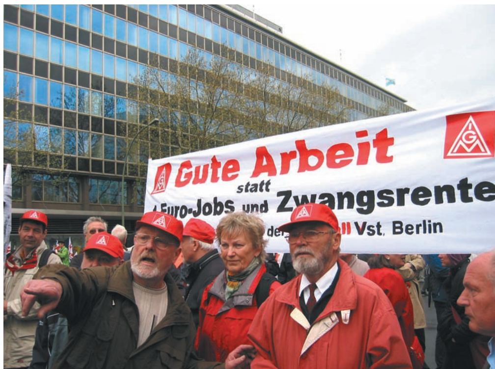
Gewerkschafterinnen und Gewerkschafter forderten bei den Demonstrationen am 1. Mai, zum Beispiel in Berlin (unser Foto), in vielfältiger Form „Gute Arbeit, Gute Löhne, Gute Rente“. Die Vorschläge der LINKEN zur Rentenpolitik fanden Interesse und Zustimmung.

Desweiteren will der Studierendenverband Linke.SDS in Anlehnung an die „Hochschuldenkschrift“ des SDS aus den 1960er Jahren eine Analyse der Hochschule im heutigen Kapitalismus erarbeiten, um damit den Kampf gegen Studiengebühren zu stärken.