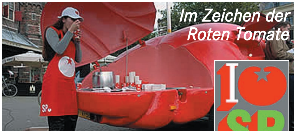
Im Zeichen der Roten Tomate

Wir kommunizieren auf ganz unterschiedliche Weise. Wir haben eine gute Website. Sie wird so oft besucht wie die Websites der anderen Parteien.