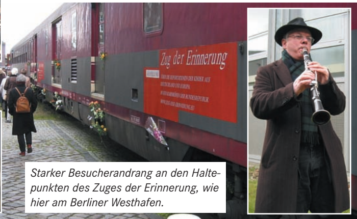
Starker Besucherandrang an den Haltepunkten des Zuges der Erinnerung, wie hier am Berliner Westhafen.