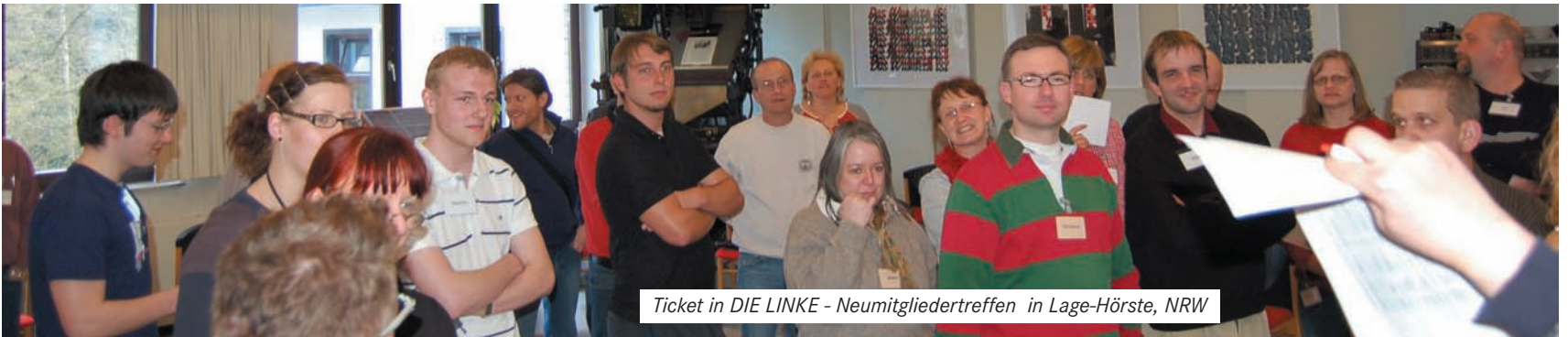
Ticket in DIE LINKE - Neumitgliedertreffen in Lage-Hörste, NRW